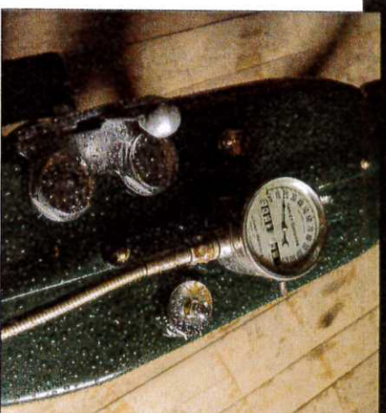
Ikke effektakk. Det regnet kraftig den dagen vår fotograf var på besøk.